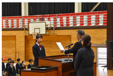
立派に証書を受け取りました