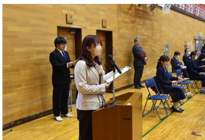
初めての修了生を出した先生