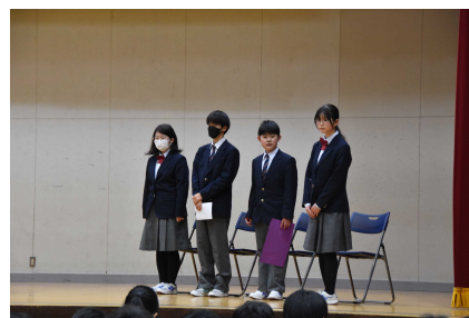
すばらしい振り返りを発表した生徒