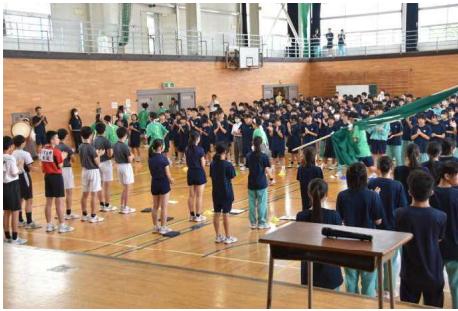
現応援団による最後の壮行式 【命の大切さを学ぶ学習】