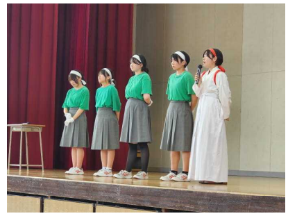
3年生応援団引退のあいさつ