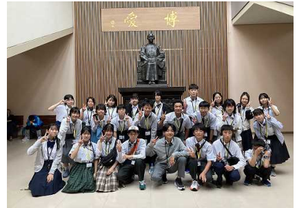
名残を惜しんだ全員集合写真