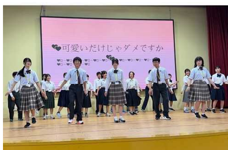
中学5校参加者全員によるダンス披露