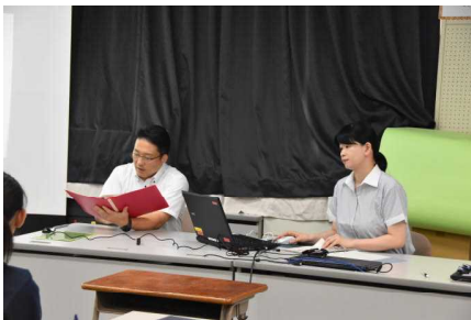
来校された宮城県警の方々 【富谷市中学生海外派遣・台湾】