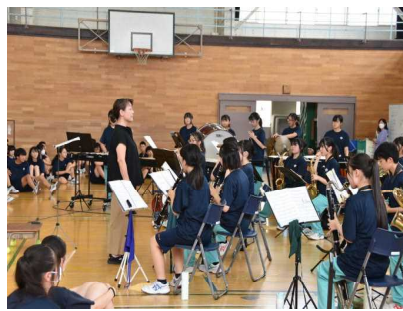
壮行式での吹奏楽部演奏