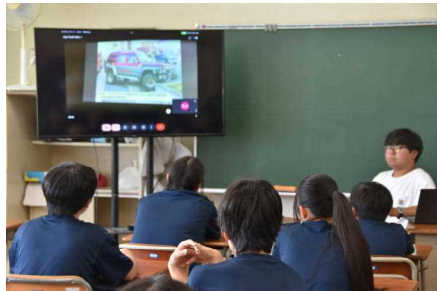
真剣に耳を傾ける生徒たち