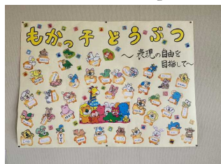
3年2組 「もかっ子どうぶつ」