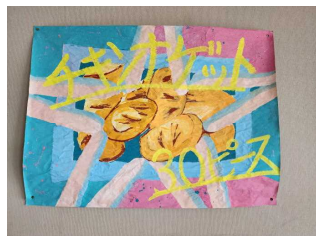
1年2組 「チキンナゲット30ピース」