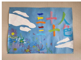
1年1組 「三十人三十色」

令和6年度、日吉台中学校ではSDGsを意識した取組を行っており、その一環として各クラスに学級憲章を作成しました。一生懸命にクラスで考え作成したものです。