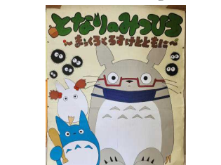
3年3組 「となりのみつひろ」