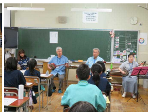
1学年地域学習 「三線体験」