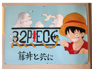
2年1組 「32piece 藤井と共に」