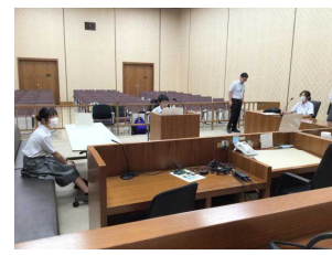
2学年仙台自主研修 「裁判体験」

7月は、1年生が「地域学習」、2年生が「仙台自主研修」を実施しました。今後の自分自身の「志」や、「キャリア」を考えるきっかけになりました。ご協力いただいた皆様に厚く感謝申し上げます。