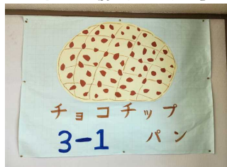
3年1組 「チョコチップパン」