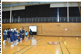
1学年地域学習 「ドローン操縦体験」