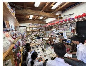
2学年仙台自主研修 「だるま作り」